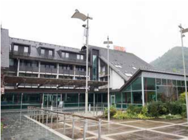
Hotel Cerklje je že pol leta zaprt.

V Postojnski jami, d. d., pojasnjujejo, da je težko napovedati, kdaj in kako dolgo bo potekala obnova Hotela Cerklje, največjega ponudnika nastanitvenih kapacitet na Cerkljanskem, ki je zaprt že od aprila. Med drugim so odgovorili tudi na vprašanja, kako so poleti izkoristili nastanitvene kapacitete v Alpski perli in kako so pripravljene na zimsko sezono.