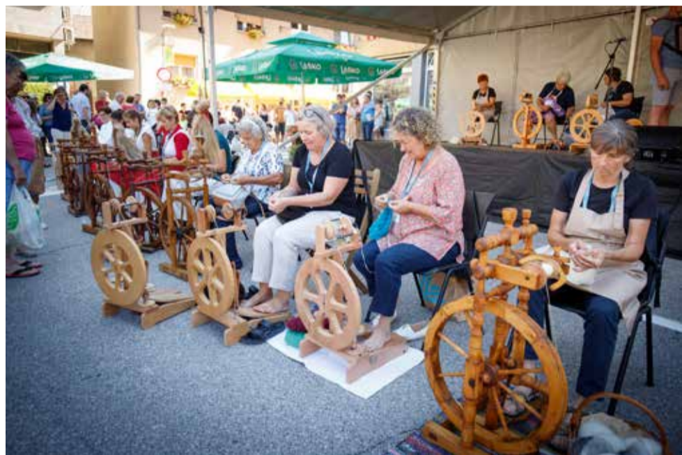
Vseslovenskega srečanja predic v Cerknem se je udeležilo več kot 20 deklet in žena.