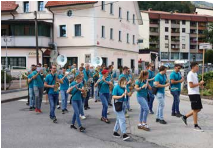
Sedmega septembra je po ulicah Cerknega spet odmevala glasba tradicionalnega Pihnfesta.

V soboto, 7. septembra, smo cerkljanski godbeniki zopet priredili mednarodni glasbeni festival Pihnfest. Cerknio, ki se zdi z nedaleč stran najdenim najstarejšim glasbilom na svetu idealna lokacija za tovrsten festival, septembra že tradicionalno odmeva v ritmih glasbe in navdušuje vse prisotne. Letos smo na Pihnfestu gostili kar dve domači godbi. Pridružila sta se nam Pihalni orkester Salonit Anhovo in Kraška pihalna godba Sežana.