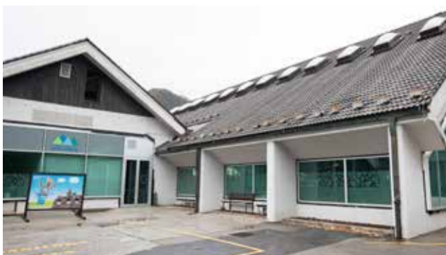
Za najem bazena v Cerklju ni zanimanja.

Obnovljen hotel bi za širše območje zagotovo pomenil prvo resno investicijo po dolgem času. V turizmu na Cerkljanskem se v zadnjih dvajsetih letih ni vlagalo praktično nič. Zadnja omemba vredna investicija je bila v Alpsko perlo pred skoraj dvajsetimi leti. To pove veliko. Zgolj prenovljen hotel in naš angažma pa nista dovolj. Potreben je premik v razmišljanju in pristopu vseh do turizma. Ne predstavljamo si, da bi zgradili hotel, delovno silo pa bi morali pripeljati od vsepovsod, samo iz bližnje okolice jih ne bo. Potem je tu še neprepoznavnost destinacije, kjer morata svojo vlogo odigrati lokalna in