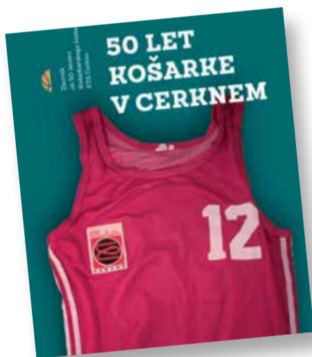
Ob jubileju je izšel zbornik, ki ga je uredil Franci Ferjančič.

katerem so se zbrali nekdanji in sedanji člani kluba, so bilten pohvalili in sprejeli z navdušenjem. V petek dopoldne je v telovadnici Osnovne šole Cerkno v organizaciji Košarkarske zveze Slovenije in trenerjev KK ETA Cerkno potekal dogodek Igriva košarka za učence prve triade. Najmlajši so bili veseli maskote Lipkota in prijetnega druženja z žogo in upati je, da se bo še kdo navdušil za košarko. Že sedaj v štirih skupinah deluje okrog 65 deklic in dečkov vseh starosti. Na petek je v dvorani Glasbene šole potekala tudi svečana akademija, na kateri so obeležili preteklost kluba s