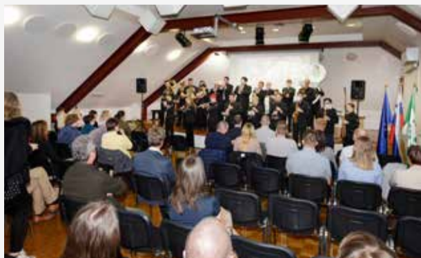
Nastop Društva godbenikov Cerklno na slavnostni akademiji ob občinskem prazniku 1. oktobra.

Danes ne moremo prezreti dejstva, kako močno nas povezuje glasba in šport. Že od nekdaj sta bila to dva stebra, ki povezuje mlado in staro. Prav društvo godbenikov in košarkarski klub