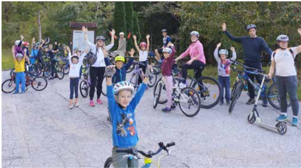
Udeleženci kolesarske ture proti Dolenjim Novakom v okviru aktivnosti ETM 2024

Od 14. do 22. septembra se je odvijal Evropski teden mobilnosti (ETM), v katerem je sodelovala tudi naša občina in katerega tema je bila letos Udoben javni prostor – za vse.