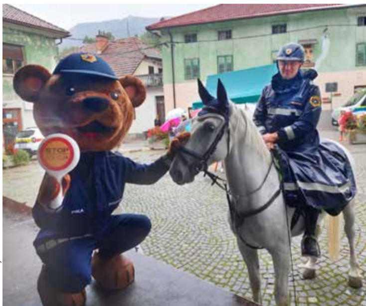
Na trgu pred fontano so se ob Evropskem tednu mobilnosti predstavili tudi policisti.

Vozim z naslovom Vozim, vendar ne hodim PLUS. Med tednom je v sodelovanju s podjetjem ETA Cerklje in Občino Cerklje potekala tudi aktivnost Teden brez