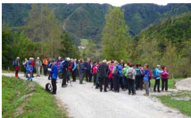
Postanek na pohodu po Bevkovi poti iz Hudajužne, v ozadju Obloke

Letošnjega 14. pohoda po Bevkovi poti iz Hudajužne v Zakojco, ujetega v Bevkove dneve in v Festival pohodništva Dolina Soče, se je udeležilo skoraj 60 pohodnikov iz različnih krajev Primorske in Gorenjske. Po dobrodošlici v Hudajužni jih je KTT društvo Baška dediščina povabilo k Bevkovi info točki in h kulturnemu programu, ki je pod naslovom Kulturne poti, mreženja in povezovanja sledil usmeritvam letošnjih Dnevov evropske kulturne dediščine.