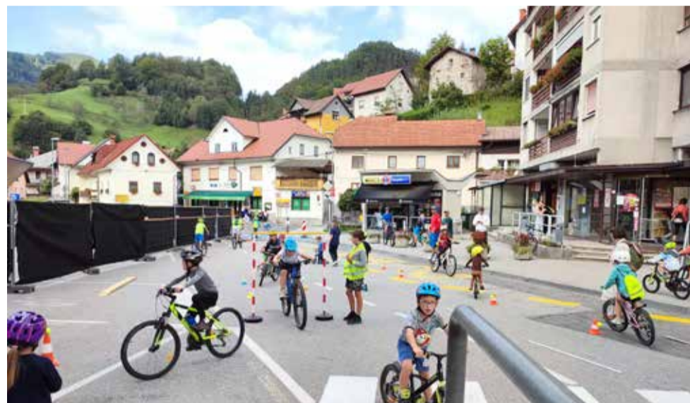
Aktivnosti za najmlajše ob Evropskem tednu mobilnosti na Glavnem trgu v Cerknem

Na grbinastem poligonu v Cerknem je bila izvedena delavnica varne vožnje. Otrokom je pravila varne vožnje in osnove »pumpanja« predstavilo Športno društvo Pedal. Za učence 9. razreda Osnovne šole Cerkno je bila organizirana delavnica Zavoda VOZIM z naslovom Varnost v prometu in e-skiro. Otroci so se seznanili s cestno-prometnimi predpisi in pomenom varnosti v cestnem prometu, za katero je ključna priporočena zaščitna oprema, v drugem delu delavnice pa so se preizkusili v vožnji z uporabo e-skiro simulatorja. Za odrasle je bil v Večnamenskem centru Cerkno organiziran dogodek »Meritve krvnega tlaka in zdrav krožnik« v izvedbi Centra za krepitev zdravja Ildrija. V izvedbi Zavoda Varna pot je bila za