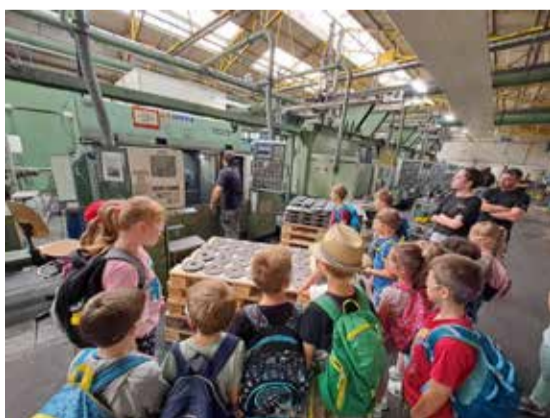
ETA je tudi letos financirala počitniško varstvo za najmlajše osnovnošolce.

Počitniško varstvo za otroke od 1. do 4. razreda, ki ga je že peto leto zapored financirala ETA, se je z zadnjim avgustovskim dnevom zaključilo, otroci pa so že zakorakali v novo šolsko leto. 45 vključenih otrok je imelo pester program aktivnosti: od športno-likovnih obarvanih dnevov, izletov, obiska pri kajakaših in gasilcih, obiska v našem podjetju, delavnic CKZ Idrija, balinanja do kopanja v bazenu ... In še in še. Za odlično izvedbo so tokrat poleg učiteljev OŠ Cerknjo poskrbeli tudi dijaki idrijske in viške gimnazije iz Ljubljane ter tako iz prve roke spoznavali veščine pedagoškega poklica. Upamo, da bodo otrokom poletne dogodivščine še dolgo ostale v spominu! (Lilijana Strmšek) 🌱