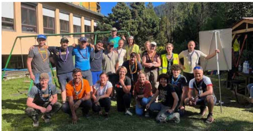
Cerkljanski taborniki so po ujmi pomagali na Koroškem.

V soboto je bilo tako zaprtih 30 delovišč (sortiranje odpadkov, čiščenje rečnih brežin in naplavin, čiščenje zasebnih domov – predvsem kleti, odnašanje mulja, pomoč pri spravilu sena, da so lahko domačini opravljali težja strojna dela ...). Okrog 300 prostovoljcev je opravilo prek 2100 prostovoljskih ur. V nedeljo je bil pred nami še večji izziv, saj je okrog 400 prostovoljcev