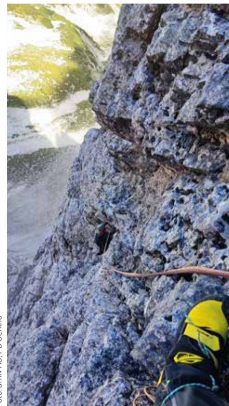
Člani AO PD Cerkno v Trbiški krniški špici

ostaja in zato so tudi letos predstavniki PD Cerkno položili šopek k spomeniku na vrhu Porezna. V sončnem vremenu je srečanje s starimi znanci in navezovanje stikov z novimi ob dobrotah iz kuhinje koče na Poreznu hitro minilo.