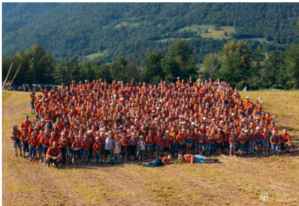
Na Marmeljadi, taboru vseh primorskih skavtov

Bodite pripravljeni – vedno pripravljeni! 🌟