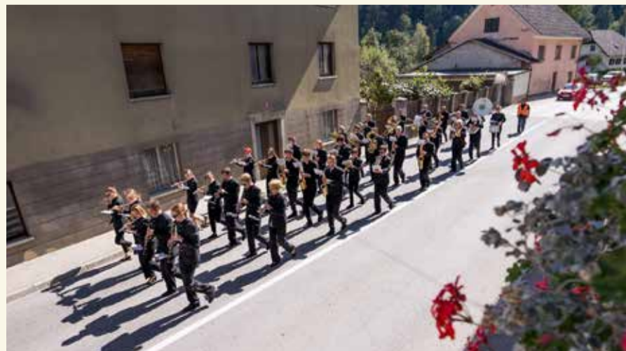
Tradicionalni Pihnfest je 9. septembra popestril ulice Cerknega.

V soboto, 9. septembra 2023, je bilo v Cerknem pestro dogajanje. Tradicionalni Pihnfest so v dopoldanskem času dopolnile cerkljanske pajtičke, popoldne pa so se po ulicah že oglasili znani godbeniški zvoki. Tokrat sta v goste prišli dve godbi, Pihalni orkester Alpina Žiri in Godbeno društvo Prosek. Skupaj smo popestrili septembrsko soboto in večer zaključili s programom na osrednjem trgu. Med dogodkom so se godbeniki imeli možnost tudi okrepčati, za kar se sodelujočim gostincem zelo lepo zahvaljujemo. Pihnfest je otvoril novo glasbeno sezono Društva godbenikov Cerkno. Za letošnje koncerte pripravljamo narodnozabavno poslastico z gosti, ki bo zagotovo ogrela mrzle decembrske večere in nas popeljala v jubilejno leto 2024, ko bo društvo praznovalo 50 let delovanja. (Mojca Sedež Selak) 🌱