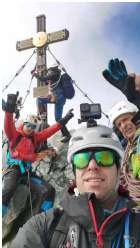
Na vrhu Velikega Kleka (Großglockner), 3798 m

Poletno srečanje planincev na Poreznu pa vse bolj postaja prav to, čeprav je bilo na samem začetku pred skoraj petdesetimi leti mišljeno kot nadomestno srečanje za tiste, ki se iz različnih vzrokov niso mogli udeležiti zimskega (marčnega) pohoda. A spomin