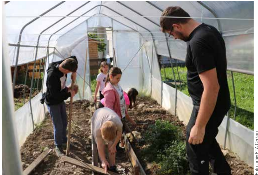
Učenci OŠ Cerknjo urejajo šolski vrt.

V izvajanju so še aktivnosti ICRE v okviru lokalnih dogodkov, kot so EKO tržnice in Pajtička fest. Občina Cerknjo se je odločila, da bo vsakemu novorojencu v občini podarila eno