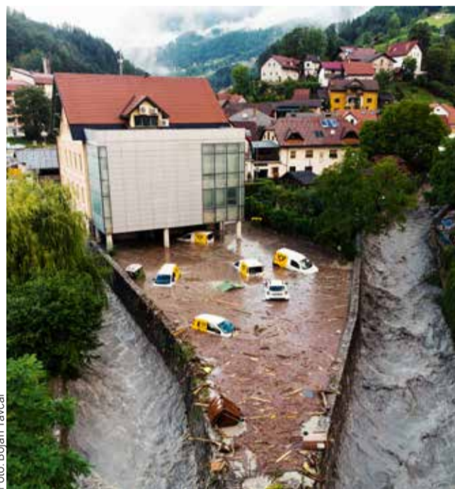
Poplavljen voznik park Pošte Slovenije pod občinsko stavbo v središču Cerklnega

Župan Gašper Uršič je povedal, da se je stanje po popisih škode in oddaji zahtevkov do države rahlo umirilo. »Občina že izvaja delno sanacijo na poškodovani infrastrukturi, predvsem na lokalnih cestah, ter dostopni cesti za čiščenje zadrževalnikov na plazu Zanjivč. V pripravi je tudi projektna dokumentacija za pridobitev sredstev iz naslova povračila sanacijskih sredstev na poškodovani javni infrastrukturi. Pozitiven premik je tudi koriščenje dodatnih sredstev, odobrenih s strani države za urejanje vodotokov s strani